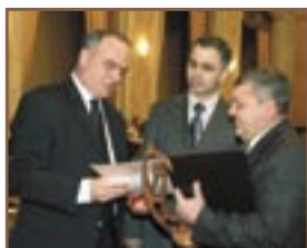
► Com. Găleşti, r-nul Strășeni