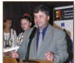
► com. Tigheci, r-nul Leova