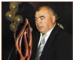
► com. Bădiceni, r-nul Soroca