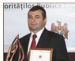
► s. Manta, r-nul Cahul