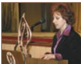
► S. Crihana Veche, r-nul Cahul