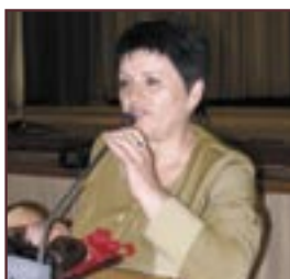
► s. Verejeni, r-nul Telenești