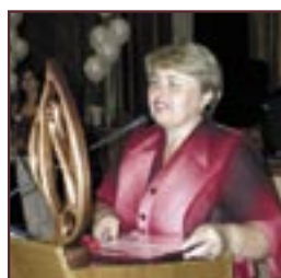
► com. Chișcăreni, r-nul Sîngerei