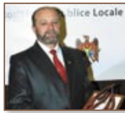
► Or. Anenii Noi