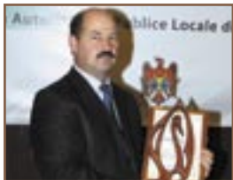
► com. Sărata Galbenă, r-nul Hîncești