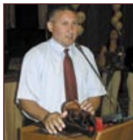
► s. Feștelița, r-nul Ștefan Vodă