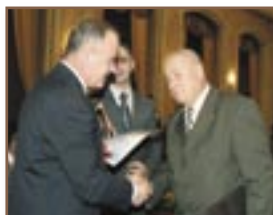
► S. Pohoarna, r-nul Șoldănești