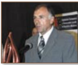
► s. Tătărești, r-nul Strășeni