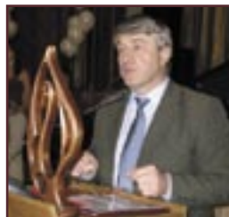
► Or. Nisporeni