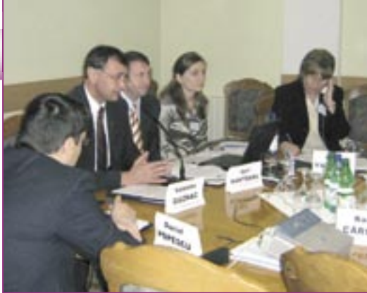
Reuniunea Grupului Coordonator în octombrie 2007

Programul este finanțat de către Consiliul Europei. Institutul pentru Dezvoltare și Inițiativă Sociale (IDIS) "Viitorul" asigură suportul administrativ și implementarea logistică a Programului.