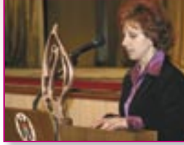
■ S. Crihana Veche, r-nul Cahul