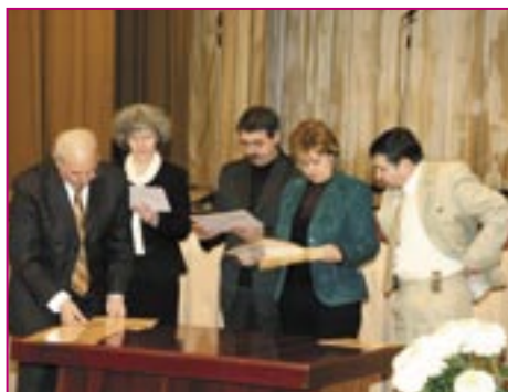
Membrii Panelului Consultativ se pregatesc de înmînarea Certificatelor participanților la PBP

După ce vor fi vizitate, aceste autorități publice locale vor fi invitate să prezinte bunele lor practici membrilor Panelului Consultativ și ai Grupului Coordonator al Programului în cadrul unei ședințe organizate la sfârșitul lunii August 2008 . În urma acestor prezentări și a vizitelor anterioare, membrii Panelului Consultativ și Grupului Coordonator vor decide asupra selectării a 6 autorități publice locale cărora le va fi acordat Statutul „ Autoritatea cu Cea