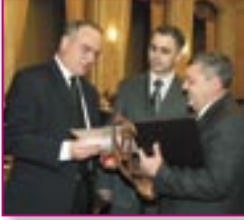
■ Com. Gălești, r-nul Strășeni

În 2007 6 primării au primit diplome din partea Ministerului Administrației Publice Locale, un computer și un set de cărți din domeniul guvernării locale din partea Consiliului European.