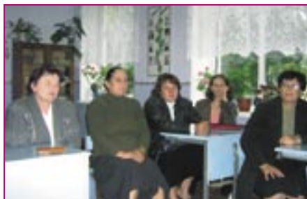
Participanți la vizita de evaluare în s. Chetrosu, r-nul Drochia

REPRODUCERE: poate fi implementată în alte comunități, iar autoritatea publică locală care a elaborat această practică are capacități efective de replicare