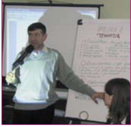
Atelier de selectare a temelor la Reuniunea Grupului Coordonator

Bunele practici la acest capitol se referă la promovarea