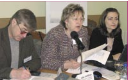
Experți internaționali și locali la Reuniunea Grupului Coordonator