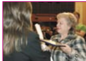
■ s. Ciocîlteni, r-nul Orhei