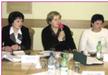
Primari – membri ai Grupului Coordonator

Administrarea, din perspectiva autorităților publice locale, înseamnă mai mult decât management. Persoanele cu atribuții în acest domeniu participă la procesul decizional înainte chiar de proiectarea unui proces administrativ, iar munca lor continuă și după ce acest proces s-a încheiat. Ele identifică acele nevoi ale localității care sunt necesare și prioritare, participă la perfecționarea activității consiliilor locale, la elaborarea strategiei administrării, la crearea serviciilor publice, gestionarea patrimoniului public, la evaluarea costului demersului administrativ și asigurarea fondurilor, la analiza gradului de co-participare a cetățenilor ce își satisfac cerințele prin actul administrativ și încearcă