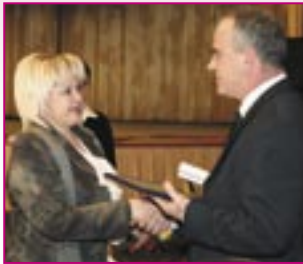
■ s. Lujnoe, r-nul Cahul

3 primării au primit Mențiuni Onorabile și un set de cărți din domeniul guvernării locale.