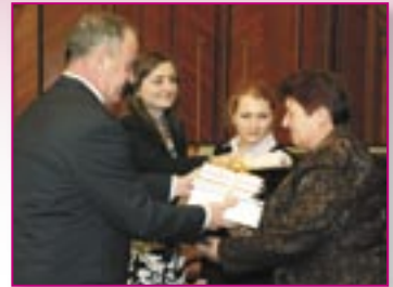
■ com. Larga, r-nul Briceni