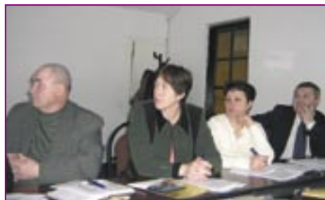
Participanți la Cursul de Instruire pentru APL câștigătoare în 2007