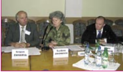
Membri ai Grupului Coordonator