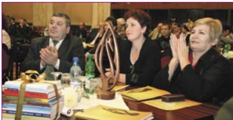
Primari – participanți la PBP în timpul Cereemoniei Naționale de Premiere în noiembrie 2007

PBP are scopul de a identifica, premia și disemina bunele practici printre autoritățile publice locale din Republica Moldova.