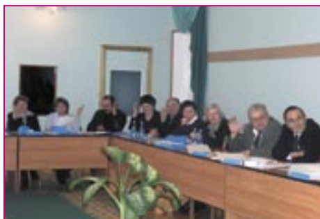
Participanții la Cursul de Instruire pentru APL care au aplicat la PBP

PARTICIPARE: au fost implicați cetățenii, au fost create parteneriate locale