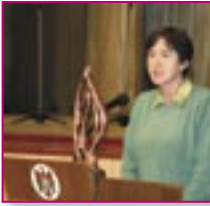
■ S. Antonești, r-nul Ștefan-Vodă